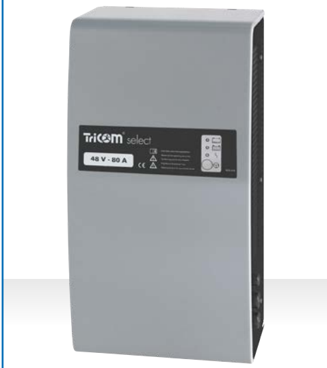
Ladegerät TriCOM select, Gehäusetyp WT 20