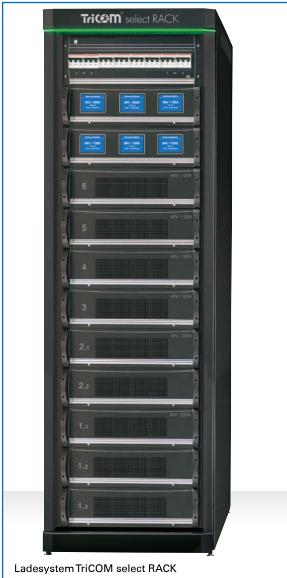
Ladesystem TriCOM select RACK