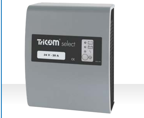
Ladegerät TriCOM select, Gehäusetyp WT 17